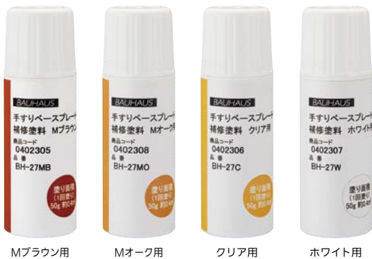
Mブラウン用 Mオーク用 クリア用 ホホワイト用